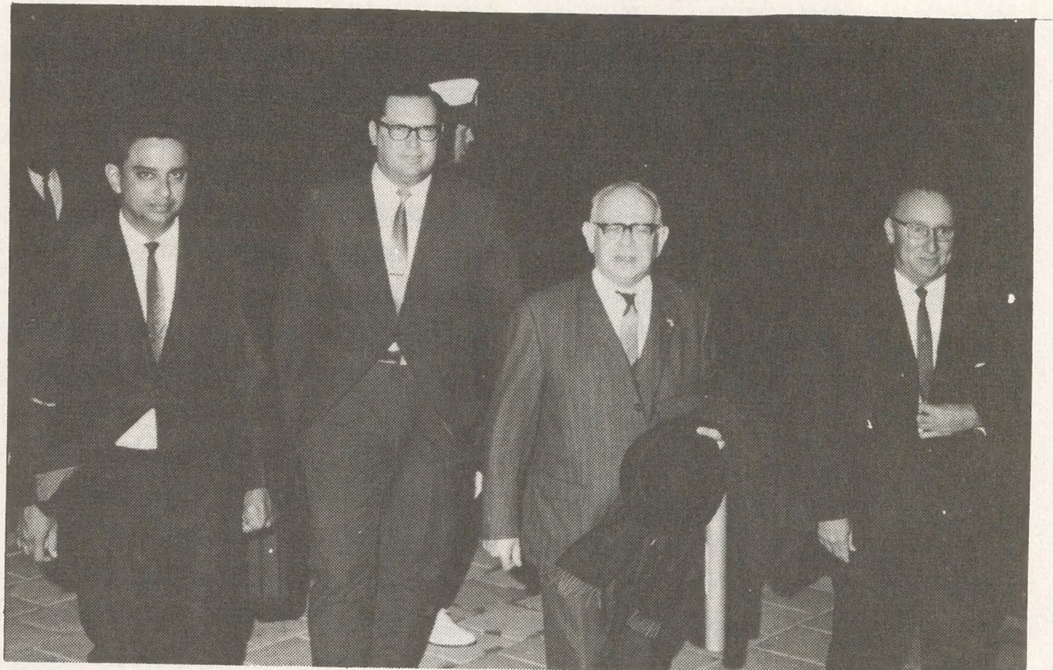
Drs. A. H. Korthals, ex-Vice-Minister-President di Hulanda i awor miembro di Raad van State, na su llegada na aeropuerto di Hato na Corsow, a pasa algun dia na cada un dje territorionan insular di Antillas Neerlandes.